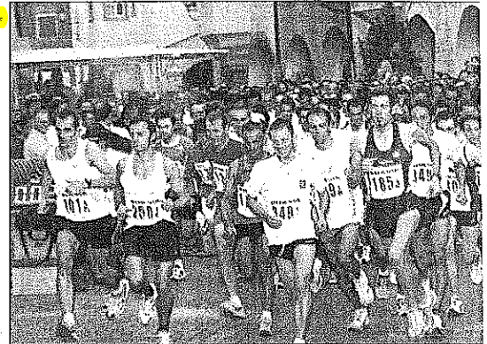
Ganz vorne weg laufen zwar meistens die Firmenmitarbeitern, doch der a Fit-for-Business-Läufer sind re:

Mit einer Rekordbeteiligung von 720 Aktiven setzte der Südtiroler Firmenlauf „Fit for Business“ im vergangenen Herbst neue Akzente. Neue Akzente sind auch für die achte Auflage garantiert, die heuer am 6. September in Neumarkt stattfindet.