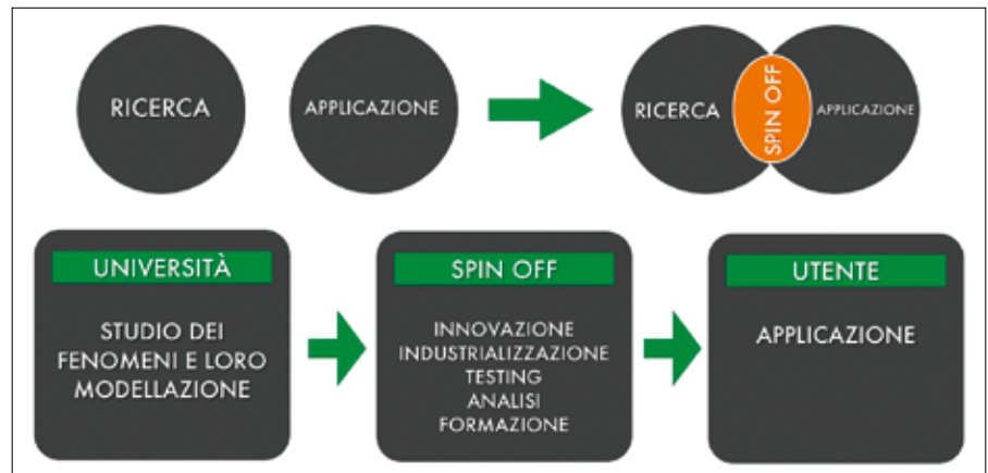
Figura 1: Lo spin-off: anello di congiunzione tra ricerca e applicazione

Trento ha supportato la nascita di uno start up e di uno spin off. Lo start up è rappresentato da K4Sint S.r.l., una micro impresa nel campo dell'ingegneria dei materiali che si occupa dei processi di consolidamento/sinterizzazione di polveri assistita da pressione. Lo spin off è rappresentato da Mountaineering s.r.l. ( www.mountaineering.com ), una neo-società di ingegneria che lavora nel settore ambientale dedicato all'analisi delle risorse e alla protezione del territorio.