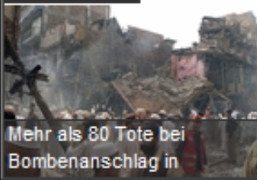
Mehr als 80 Tote bei Bombenanschlag in