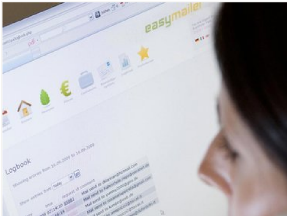
Software aus Südtirol