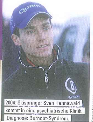
2004: Skispringer Sven Hannawald kommt in eine psychiatrische Klinik. Diagnose: Burnout-Syndrom.