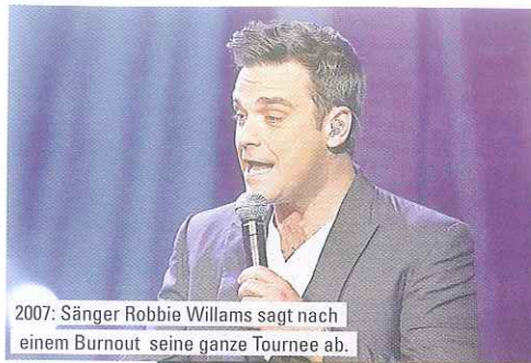
2007: Sänger Robbie Williams sagt nach einem Burnout seine ganze Tournee ab.

Nehmen Sie sich bewusst Zeit für den Partner, Freunde und Kinder, weichen Sie keinen Diskussionen aus, stellen Sie sich, hören Sie zu und machen Sie klare Ansagen. Notfalls: brechen Sie aus dem Alltag aus, tun Sie etwas Spontanes.