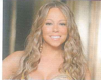
2001: Superstar Mariah Carey lässt sich in eine Klinik einweisen - Grund: Erschöpfung