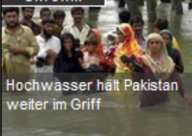
Hochwasser hält Pakistan weiter im Griff